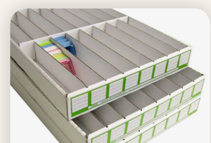
Karton blokk tároló doboz Tiba HU