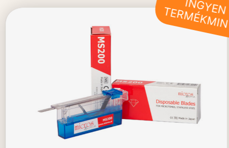
Univerzális mikrotóm penge - MS200 Micros JP