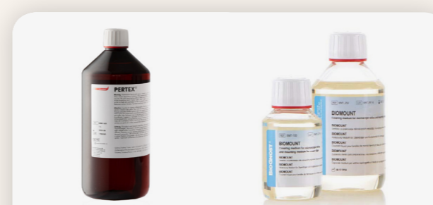
Pertex Histolab SE