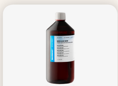
Bioclear new (Alifás szén-hidrogén alapú) Biognost HR