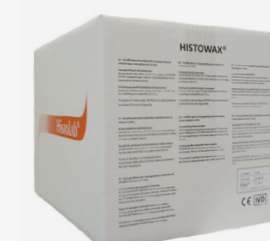
Histowax paraffin Histolab SE