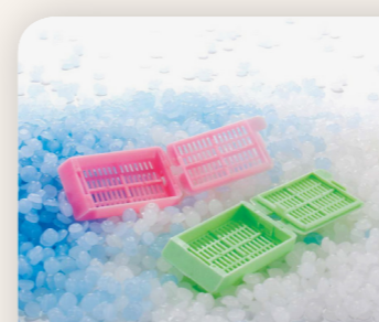
Biowax blue paraffin Biognost HR