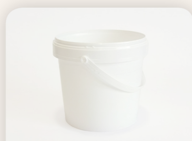
250 ml – 10 l jóli záródó, fehér konténer Tiba HU