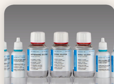
Grocott KIT Biognost HR