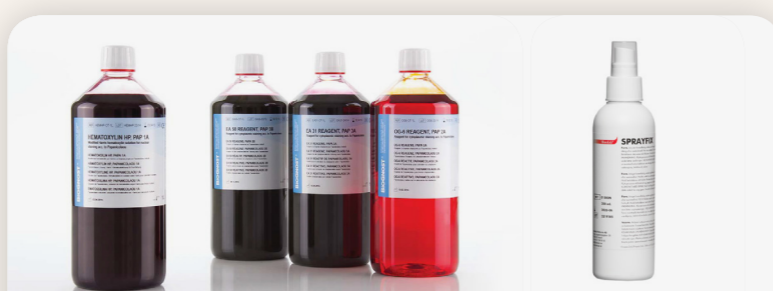
Papanicolau sor EA50, OG6, Harris HP Biognost HR